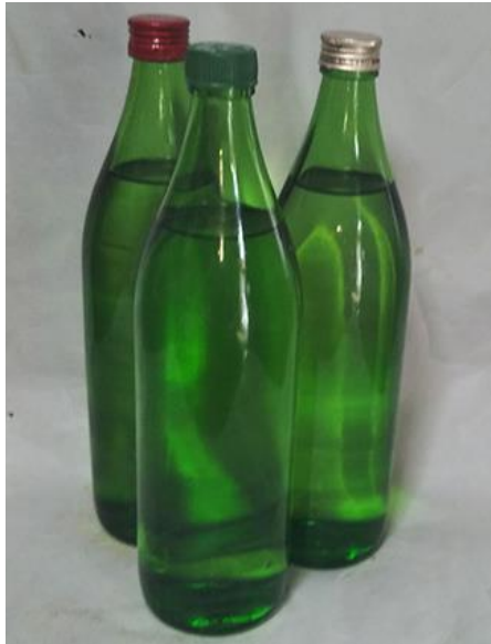
量子水原液 4合瓶 3本